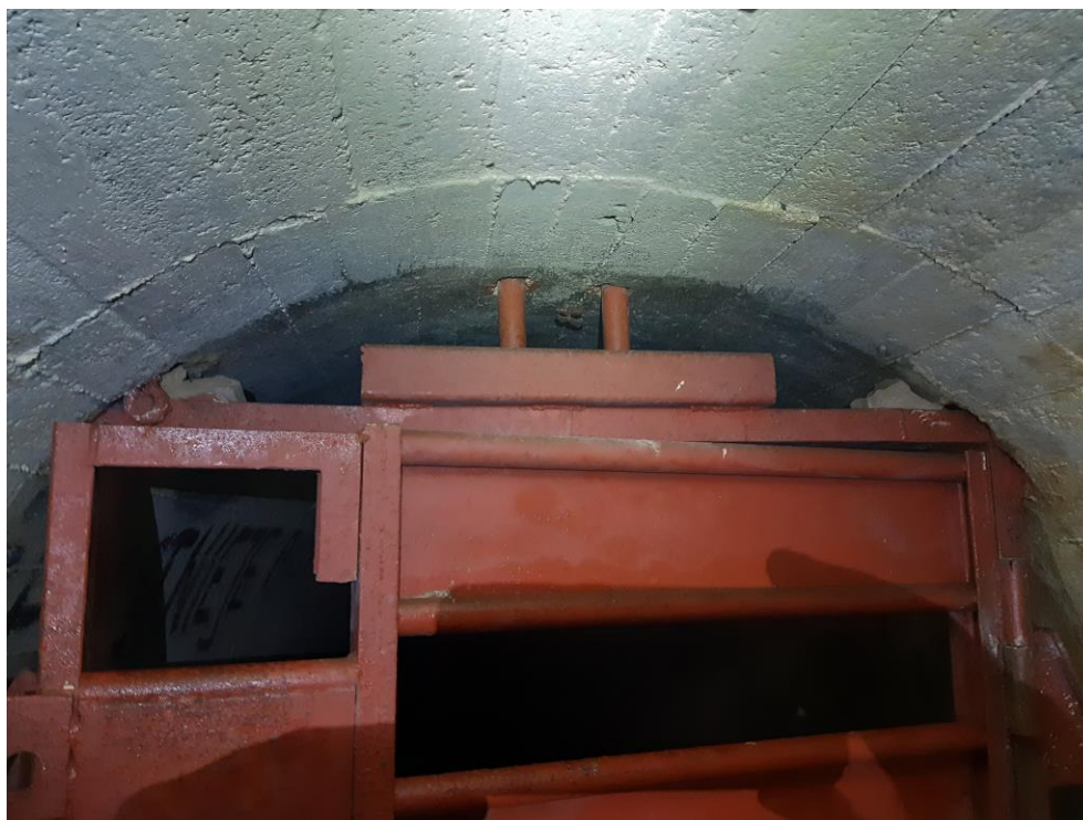
zdj. 5 – Wzmocnienia kraty w stropie.