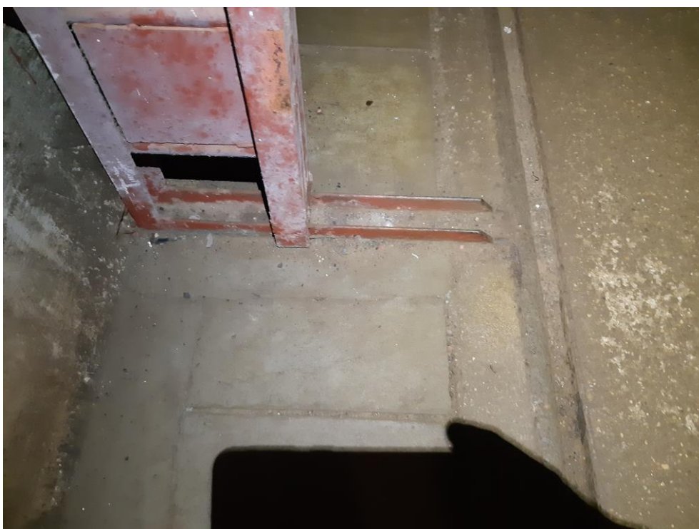
zdj. 6 – Mocowanie kraty w podłożu.