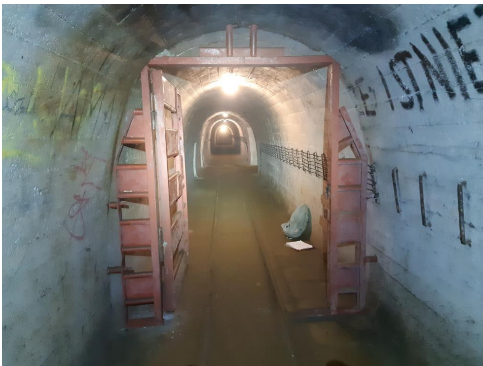
zdj. 3 – Miejsce montażu kraty – widok na korytarz.