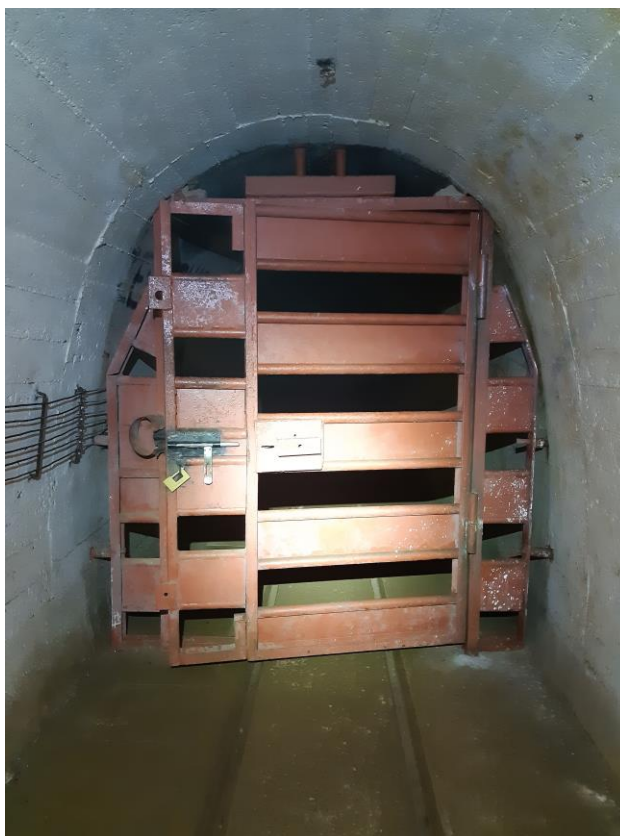
zdj. 2 – Istniejąca krata – stan obecny.