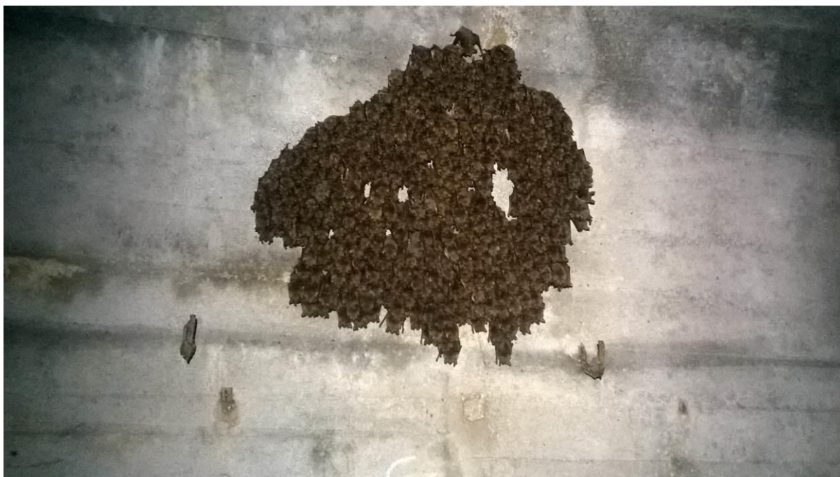
zdj. 1 – Nietoperze zimujące w MRU. [fot. A. Bator-Kocoł]