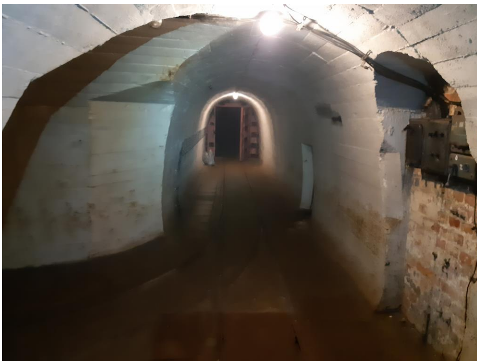
zdj. 4 – Widok na kratę od strony skrzyżowania.